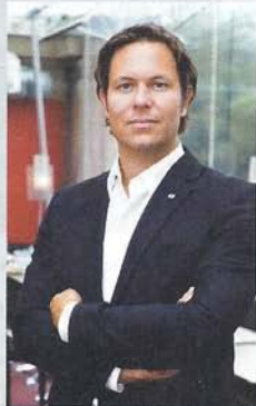
MARKUS ROTH. Bundesvorsitzender der Jungen Wirtschaft: „Auf fast alles vorbereitet sein.“

ANMELDUNG LÄUFT. Die Organisatoren erwarten rund 1.000 Teilnehmer, im Preis von 108 Euro sind auch die Galanacht im VAZ in St. Pölten und eine Party im Festspielhaus inkludiert. Anmeldung und Details unter www.jungwirtschaft.at/bundestagung