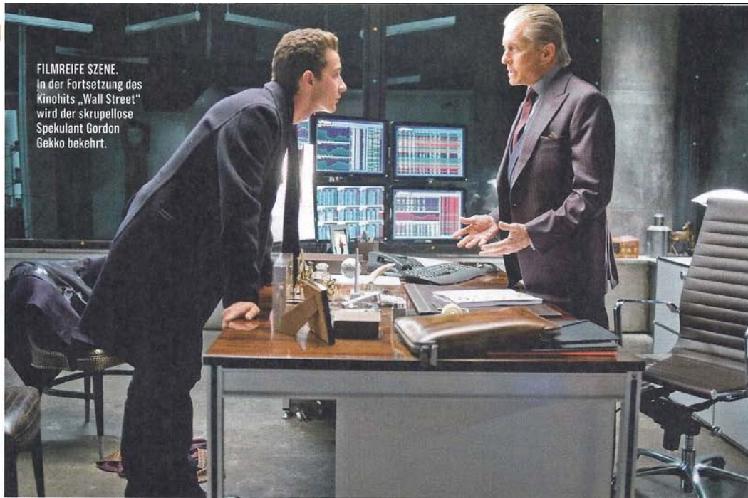
FILMREIFE SZENE. In der Fortsetzung des Kinohits „Wall Street“ wird der skrupellose Spekulant Gordon Gekko bekehrt.